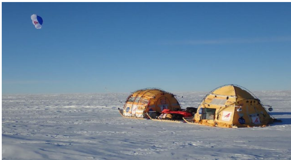
Trineo de Viento ( WindSled ) propulsado por el viento en la meseta antártica

Durante la campaña 2018-2019 en la meseta antártica, cuatro tripulantes bien entrenados recorrieron 2538 km a través del sector oeste de la meseta antártica, desde las cercanías de la estación Novolazarevskaya hasta el Domo Fuji (inferior a 3.500 m de altitud). El WindSled trasladó 200 kg de instrumentación científica para realizar múltiples muestreos y experimentos científicos in situ ; incluyendo la detección de microorganismos mediante un inmunosensor portátil (LDChip) , diseñado para la detección de vida en la exploración planetaria; un colector de aerosoles y material biológico del aire capaz de operar en las condiciones extremas de la expedición; y la monitorización continua de posibles eventos delicuescentes a lo largo del transecto.